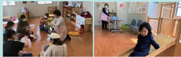
キッズひろばみなみ

おもちゃや絵本などが揃っていて、楽しく自由に過ごせ、情報交換もできます。予約制が多いので申し込みなどは各常設オープンスペースのホームページをご確認ください。